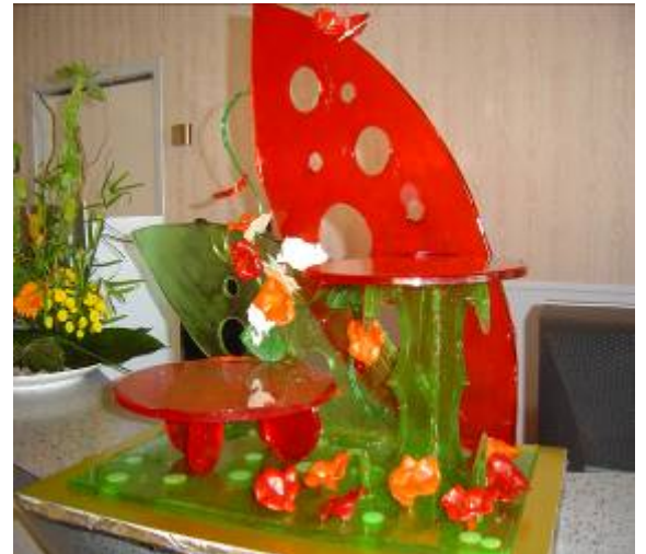
Pièce en sucre coulé réalisé pour présenter les desserts sur le buffet.

□ Le jeudi 14 janvier, déjeuner sur le thème : « Terre et Mer ». Le dessert proposé était à base de « pêche » (le fruit). Le poisson est en en pâte à cigarettes.