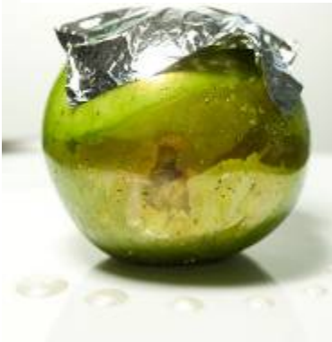
La pomme verte en sucre soufflé